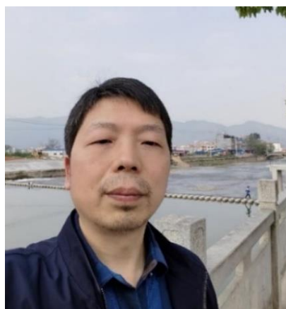
摄于 蓝山县回龙寺外舜水河边

本人跟米有缘，程中有禾，禾生大米。2000 年父母在在蓝山县湘粤路 628 号买了一栋房子（恰好与我婚宴开始的时间晚上 6:28 分一致），2006 年我在杭州澳门广场举行婚宴，2006 年杭州为亚运会启动奥体中心的建设工作（主体为两座莲花建筑），2012 年，因为做生意的缘故，买了一部奥迪车。米者炎也（参看鳞字小篆），正好与我的名字永辉和勋字相对应，勋字中含炎。