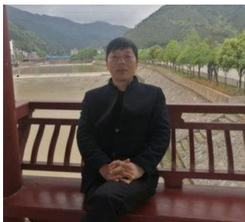
摄于 蓝山县毛俊镇俊水河